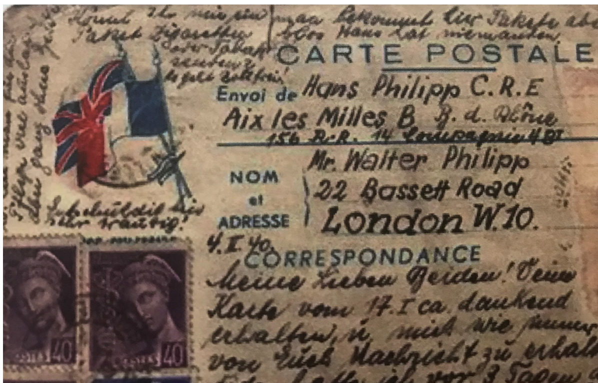
Kartenausschnitt vom 4.2.1940