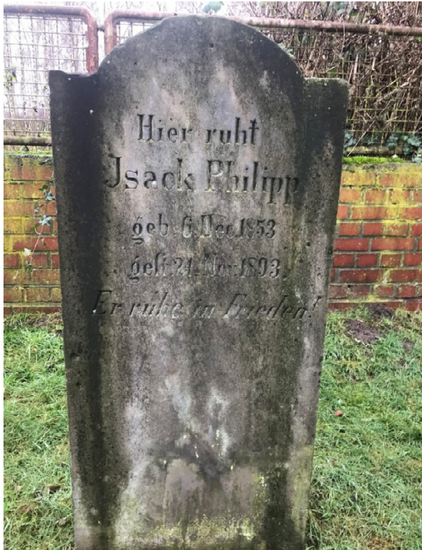
Grab auf dem Jüdischen Friedhof