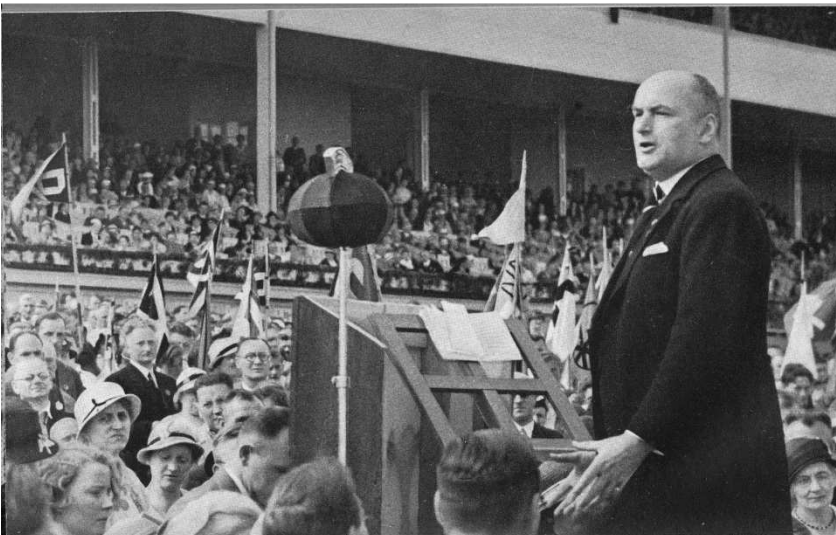
Dr. Erich Klausener in Hoppegarten am 24. Juni 1934

Nach der NS-Machtübernahme nutzte Klausener den Katholikentag in Grunewald 1933, um sich schützend vor die verfolgten Evangelischen und Katholischen Arbeitervereine zu stellen. Unverhüllt droht das NS-Parteiorgan „Völkischer Beobachter“ am 27.6.1933 dem „bald vergessenen Ministerialrat“ vor „Konsequenzen“, die „unerträgliche Redensarten heraufbeschwören könnten.