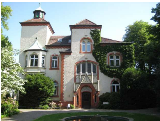
Landratsvilla, nun Musikschule