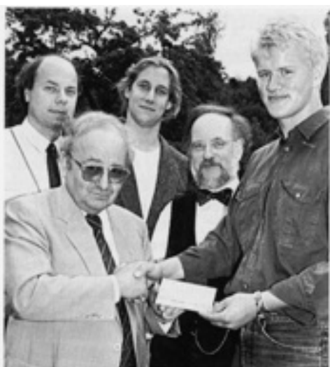
Schüler und Lehrer des Gymnasium Petrinum übergeben eine Solidaritätsspende bei Festes von Christlich-Jüd. Gesellschaft und Jüdischer Kultusgemeinde 1992