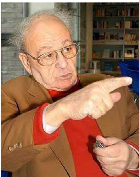
Titelfoto der Biographie

Seine Verpflichtung löste er auch bei zahlreichen Gesprächs- und Vortragsveranstaltungen v.a. an Schulen ein, obwohl ihn gerade wegen seines guten Gedächtnisses die schmerzhaften Erinnerungen sehr belasten. 11 Wegen seiner eigenen Lebenserfahrungen während der Zwangsarbeit im Außenlager Bochum, war er jahrelang an Bochumer Schulen aktiv.