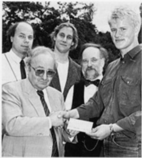
Schüler und Lehrer des Gymnasium Petrinum übergeben eine Solidaritätsspende bei Fest von Christlich-Jüdischer Gesellschaft und Jüdischer Kultusgemeinde 1992