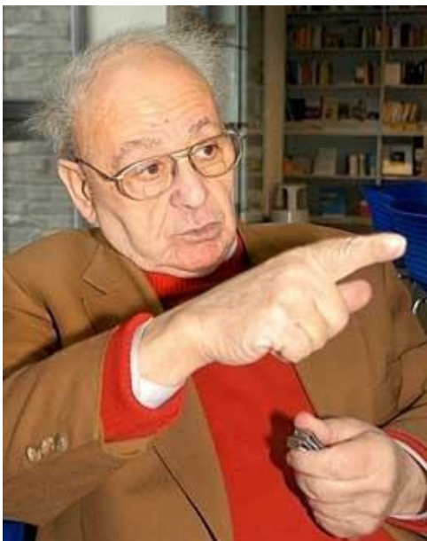
Titelfoto der Biographie

Seine Verpflichtung löste er auch bei zahlreichen Gesprächs- und Vortragsveranstaltungen v.a. an Schulen ein, obwohl ihn gerade wegen seines guten Gedächtnisses die schmerzhaften Erinnerungen sehr belasten. 11 Wegen seiner eigenen Lebenserfahrungen während der Zwangsarbeit im Außenlager Bochum, war er jahrelang an Bochumer Schulen aktiv.