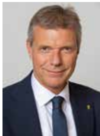
Christoph Tesche Bürgermeister der Stadt Recklinghausen