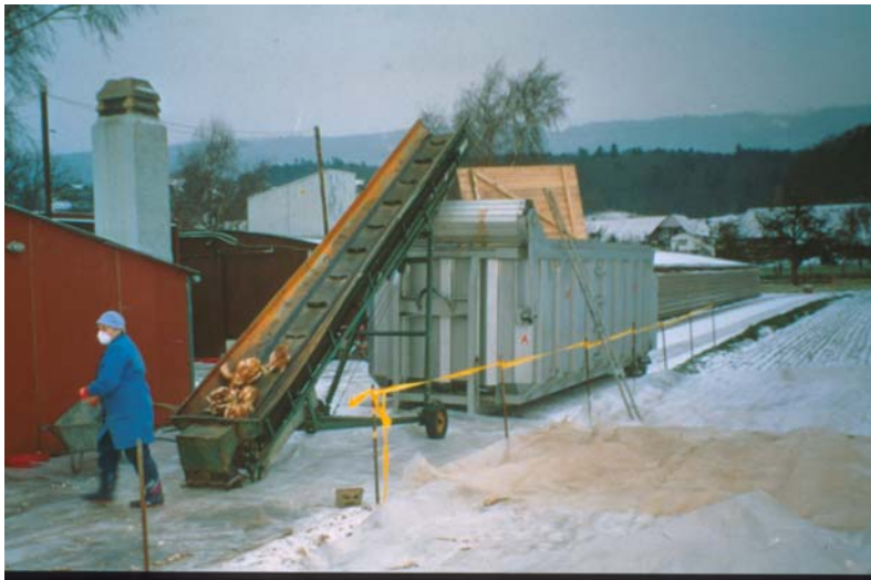
Abb. 8: An Geflügelpest verendete und getötete Hühner werden in Entsorgungsanlagen un- schädlich beseitigt.

Menschen müssen einen ungeschützten Kontakt mit erkrankten Tieren durch geeignete Schutzkleidung, Schutzhandschuhe, Mundschutz und Schutzbrille vermeiden. Personen, die sich in den betroffenen Regionen aufhalten und Kontakt zu Geflügelhaltungen haben, wird die Influenza-Schutzimpfung mit dem zugelassenen Impfstoff empfohlen. Damit soll eine Doppelinfection mit aviärem und humanem Influenzavirus vermieden werden.