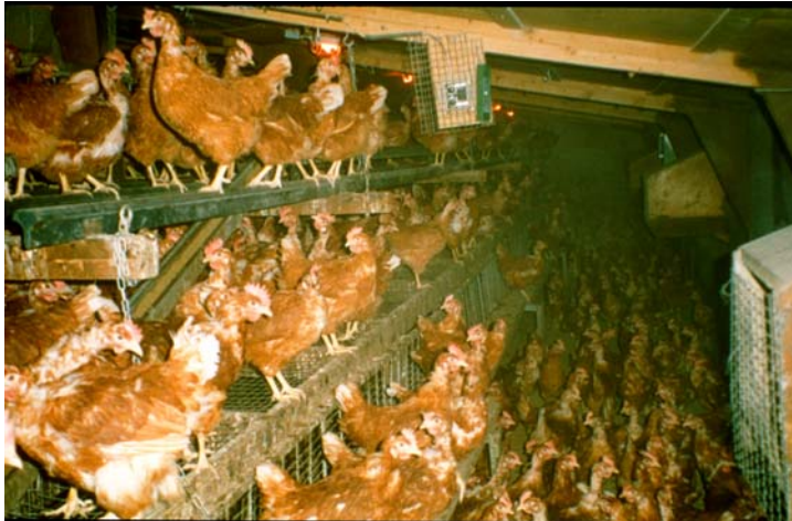
Abb. 6: In Hühnerställen mit hoher Besatzdichte verbreitet sich das Geflügelpestvirus explosionsartig, aber der Ursprung der Seuchenzüge liegt eher in Kleinbetrieben, wo Wildvögel und verschiedene Arten von Hausgeflügel engeren Kontakt haben können.

Um der Entstehung der Geflügelpest vorzubeugen, sollte Hausgeflügel keinen Kontakt mit wilden Wasservögeln haben. Bei Freilandhaltung sind entsprechende Schutzmaßnahmen zu treffen, zumindest darf die Fütterung nicht im Freien erfolgen, um keine Wildvögel anzulocken. Außerdem sollten Hühner und Puten nicht mit Wassergeflügel zusammen gehalten werden.