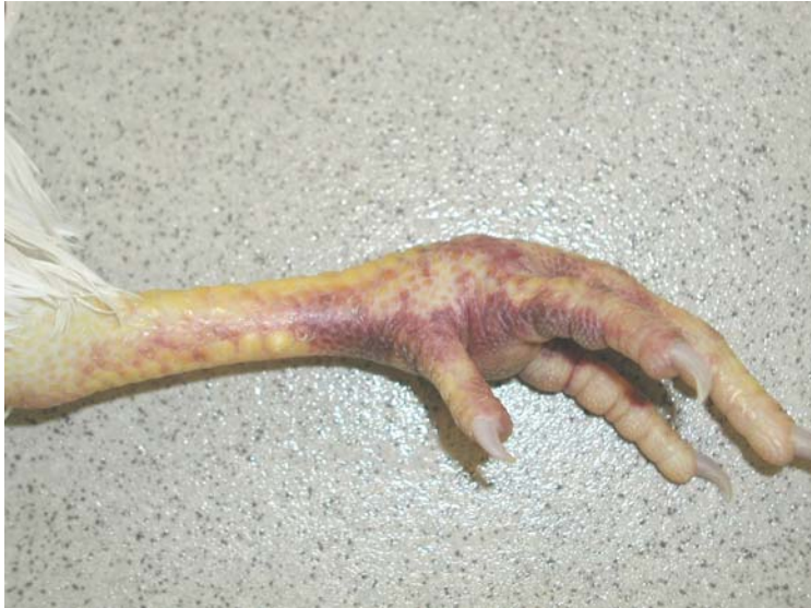
Abb. 5: Blaurote Verfärbung der unbefiederten Haut am Fuß durch Unterhautblutungen.