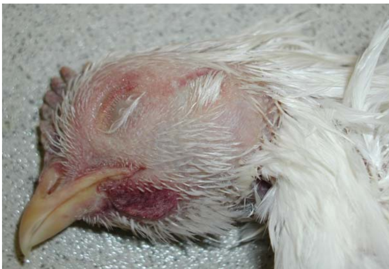
Abb. 4: Ödeme am Kopf eines an Klassischer Geflügelpest ver- endeten Huhns.