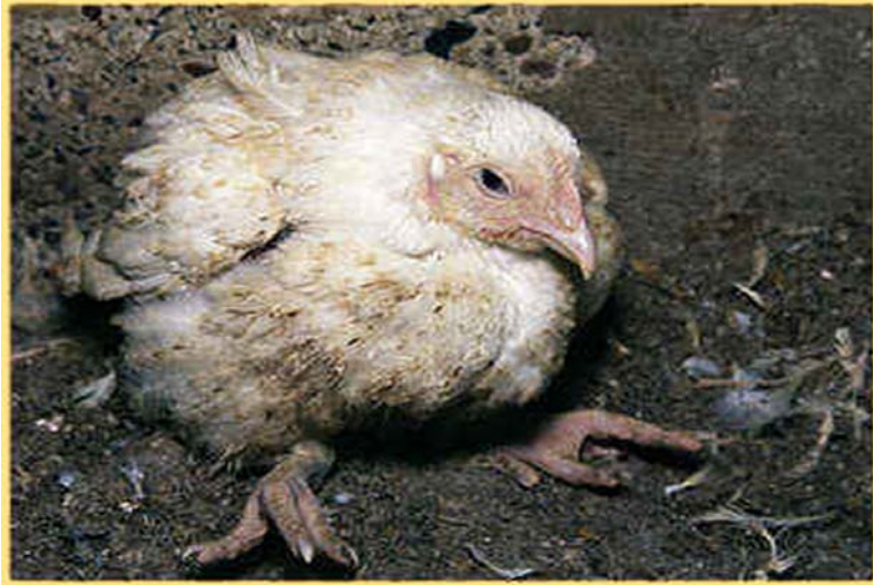
Abb. 2: An Klassischer Geflügelpest erkranktes, auf den Tarsal- gelenken hockendes Hühn- chen mit gestäubtem Ge- fieder und halb geschlos- senen Augen.