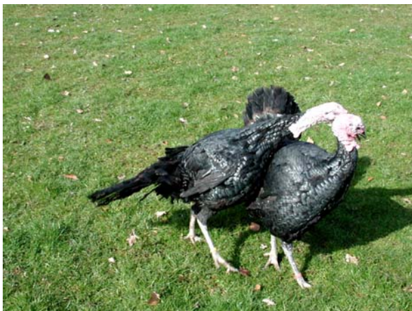
Abb. 7: Geflügel in Freilandhaltung kann durch Wildvögel mit Aviärer Influenza angesteckt werden. In Hausgeflügel kann der Erreger seine Pathogenität steigern und zum Ausbruch der Geflügelpest führen.