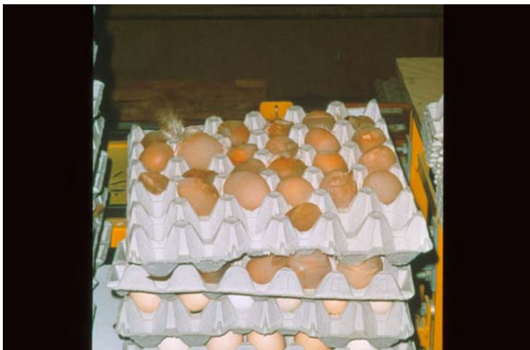
Abb. 1: Die Legeleistung fällt bei an Geflügelpest erkrankten Hühnern stark ab und die Schalen der noch gelegten Eier sind dünnwandig oder fehlen ganz.

Enten und Gänse erkranken nicht so schwer, und die Krankheit führt nicht immer zum Tod. Manchmal leiden sie nur an einer Darminfektion, die äußerlich fast unauffällig verläuft, oder sie zeigen zentralnervöse Störungen.