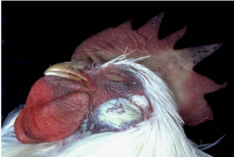
Abb. 3: Blutungen und Nekrosen an Kamm und Kehllappen eines nach experimenteller Infektion an Klassischer Geflügelpest gestorbenen Hahnes.