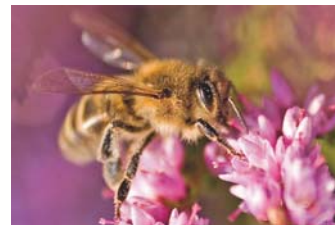
Honigbiene auf Heideblüte

Das lassen sich die fleißigen Arbeiterinnen der vier Bienen-völker vom benachbarten Bienenstand nicht zweimal sagen. Im Juni fliegen sie gern zu den weißen Blüten der Robinien am Wasserwerk, im August zum lila blühenden Heidekraut und bringen reiche Ernte mit nach Hause. Der produzierte Honig-Überschuss wird als Wintervorrat in die Waben oben im Bienenkasten eingelagert und dort vom Heide-Imker entnommen.