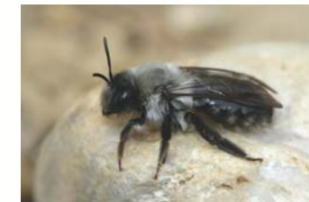
Große Weiden-Sandbiene

Bei den 48 Wildbienenarten der Westruper Heide wird im Winter nicht geheizt. So warten die jungen Weiden-Sandbienen still in ihrer Niströhre im Sand, bis sie im Frühjahr zu den blühenden Weidensträuchern ausfliegen können.