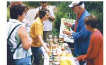
Honigstand beim Heidetag

Den leckeren Honig aus der Heide gibt es hier immer beim Heidetag des Heimatvereins Sythen. Spannende Einblicke in das Leben der Honigbienen bietet nach Voranmeldung der Lehrbienenstand im Ickerottweg 37, Recklinghausen ( www.imkerverein-recklinghausen.de ). Und gute Tipps zum Schutz der Wildbienen finden sich unter www.wildbiene.com und www.wildbienen.de .