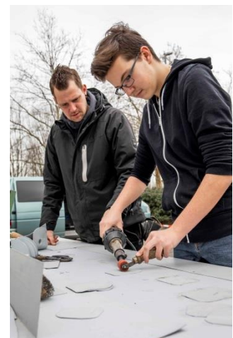
Ausprobieren und erleben stehen bei der Jobbörse an erster Stelle.

Feilen, hämmern, backen, malen – Aktionen statt trister Info-Flyer waren Mitte März an der Realschule Datteln gefragt. Die Idee: Erstmals stellen 19 Dattelner Betriebe sich und ihre Berufe vor. So hatten die Schüler/-innen die Chance, ihren zukünftigen Chef zu treffen. Der Workshop-Tag „First Job – First Contact“ kam bei Schülern, Lehrern und Betrieben so gut an, dass es 2020 eine zweite Auflage geben wird. Am Dienstag, 17. März 2020, wird an und in der Realschule Datteln den Schüler/-innen der 9. Jahrgangsstufe aller weiterführenden Schulen in Datteln ein spannendes Programm geboten. Die Vorbereitungen laufen, weitere Informationen folgen – unter anderem über die Presse.