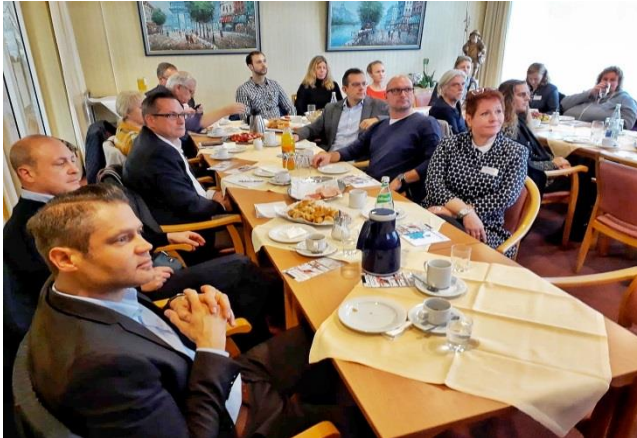
In der Ratsstube des Amarita-Seniorenzentrums informierten die Beratungsexperten der Agentur für Arbeit und des Jobcenters über Förderinstrumente.

„Verstärkung gesucht!“ oder „Wir stellen ein!“: Solche oder ähnliche Werbung ist immer öfter auf Firmenwagen oder in Anzeigen zu lesen. Der Fachkräftemangel bereitet immer mehr Unternehmen branchenübergreifend Probleme.