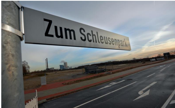
14,6 Hektar (brutto) ist das Gewerbegebiet „Zum Schleusenpark“ in Dattelns Süden groß.

Zwei Kaufverträge für Grundstücke im Gewerbegebiet „Zum Schleusenpark“ im Dattelner Süden sind unterzeichnet. Die Dekra wird ein Multifunktionsgebäude mit Fahrzeugprüfung und Büroflächen errichten und so etwa 20 Arbeitsplätze schaffen. Der Global Player Prologis errichtet im Kerngebiet des Schleusenparks, das von der 100-prozentigen Stadtochter Entwicklungsgesellschaft Süd GmbH (Ewiges) erschlossen und vermarktet wird, auf