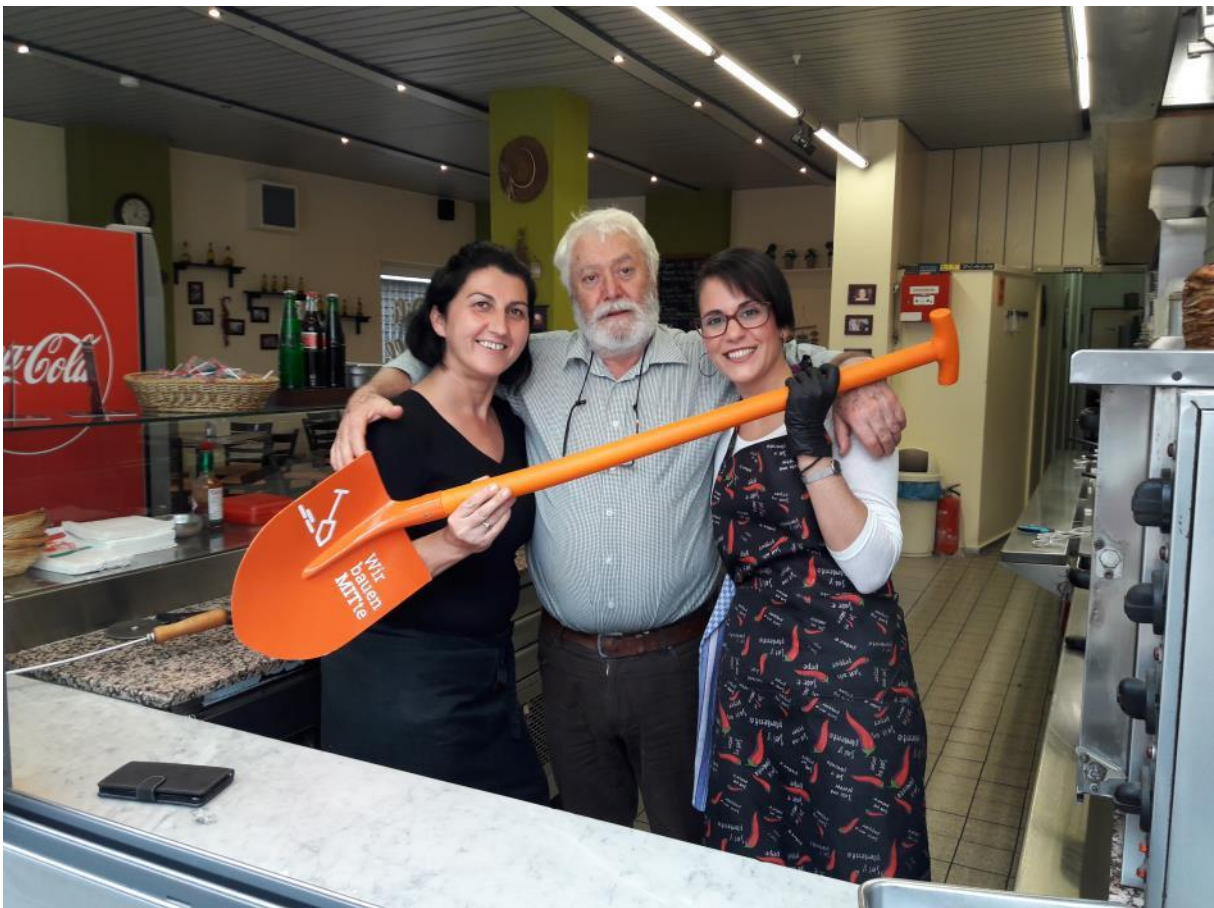
„Wir machen MITte, weil wir wissen, dass es sich lohnt und sehr schön wird. Wir freuen uns aber auch schon sehr darauf, wenn es endlich zu Ende ist.“ Team des Dili Grill

Im Rahmen des Baustellenmarketings sammeln wir aktuell Rückmeldungen zur Umgestaltung und zu den Bauarbeiten in der Fußgängerzone. Wenn Sie uns dazu Ihre Meinung sagen möchten, melden Sie sich gerne per Mail bei mir unter citymanagement@wirmachenmitte.de